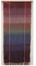
審査委員長賞 【Universal Harmony IVゆらぐ】