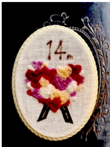
① バルンタインハート